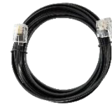
Câble téléphonie RJ11